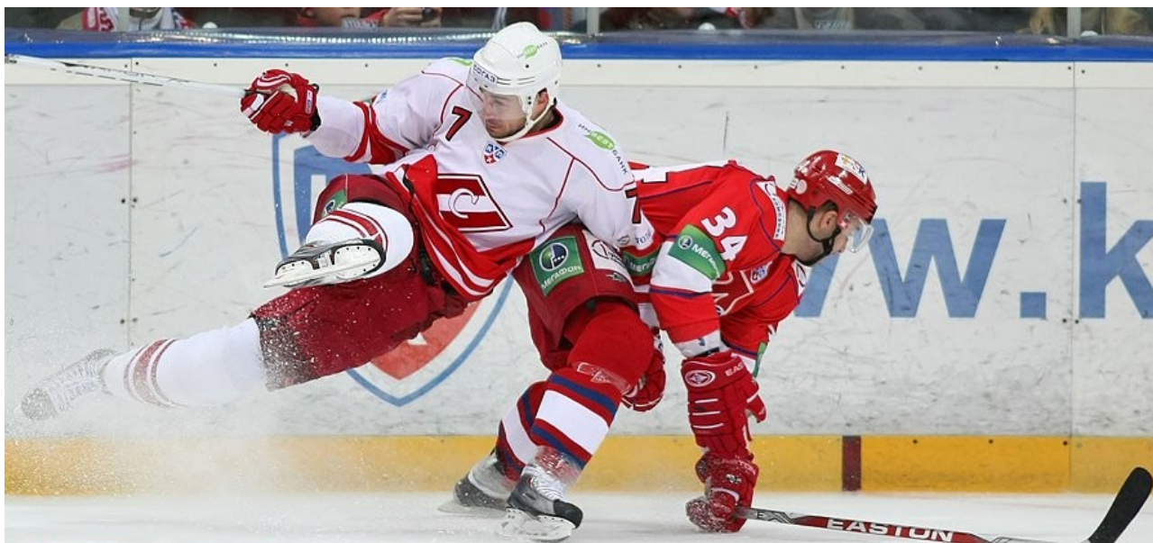
КХЛ. Плей-офф. 1/4 финала. ЗАПАД. Первые матчи

Цыбанев Ю. 20 марта 2010, «Советский спорт» №40(18068)